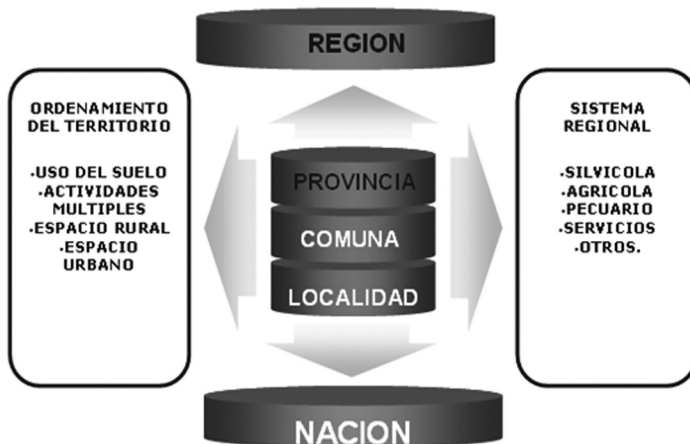
Figura 2. La Geografía Regional Sistémica

La didáctica de la Geografía bajo el precepto sistémico regional, debe abordar todas las variables e indicadores de la unidad, con un fuerte componente del conocimiento in situ y de la evolución histórica; la base del modelo permite el análisis de las particularidades vigentes y la prospectiva futura que tenga la unidad. Ambos son fundamentales, tanto el conocimiento cabal de la región, como las posibilidades de pronosis y futurización del espacio, aplicando el método científico. Los estudiantes deben prever comportamientos, establecer proposiciones, que serán la base de la realidad futura de la unidad que habitan (Figura 2).